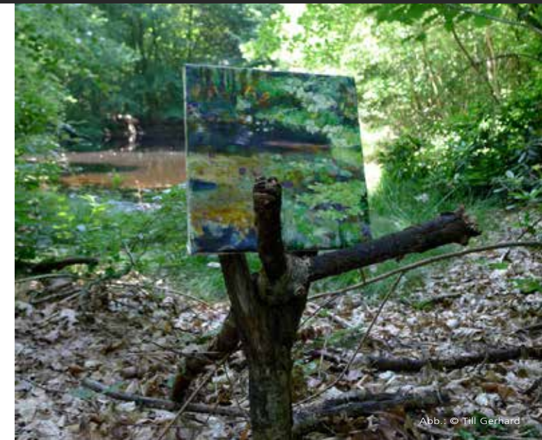
Abb.: © Till Gerhard

ROSENSTRASSE 41 | 26122 OLDENBURG TEL 0441-9990840 | FAX 0441-99908440 WWW.WERKSCHULE.DE | INFO@WERKSCHULE.DE