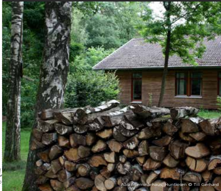
Abb.: Seminarhaus, Huntlosen © Till Gerhard